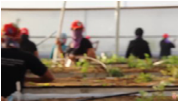
Fig.7 Mulheres do MST destroem mudas transgênicas da Suzano Papel e Celulose