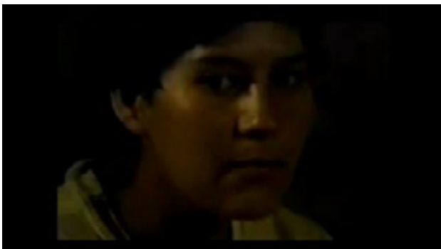
Fig.3 Rose é filmada em close, em um quadro pouco iluminado, que denota proximidade