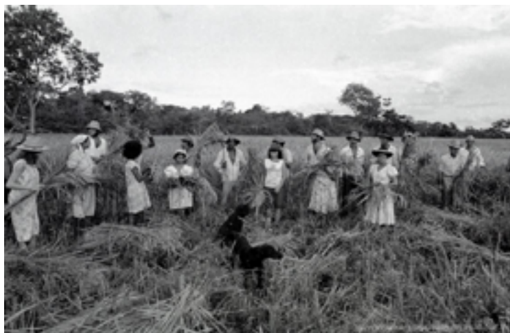
Fig 1 “colheita coletiva de arroz em Conceição de Araguaia no Pará”.

Em seu texto sobre as imagens do Movimento dos Trabalhadores Rurais Sem Terra, intitulado “Política e rito: o papel da fotografia na construção do MST” (2016), Stella Senra sugere uma curiosa associação entre o latifúndio e a imagem. Para a autora, o espaço da imagem é como um latifúndio estrategicamente ocupado pelos sem terra: o Movimento “tem usado, em relação à fotografia, um procedimento semelhante ao das ocupações, estendendo até a imagem fotográfica esta prática que ele aciona com tanta desenvoltura para a terra” (SENRA, 2016). A conexão entre as duas instâncias – latifúndio e fotografia – nos permite imaginar, além disso, que o campo lavrado, cultivado e tornado produtivo pelos trabalhadores rurais é também, afinal, o campo da imagem.